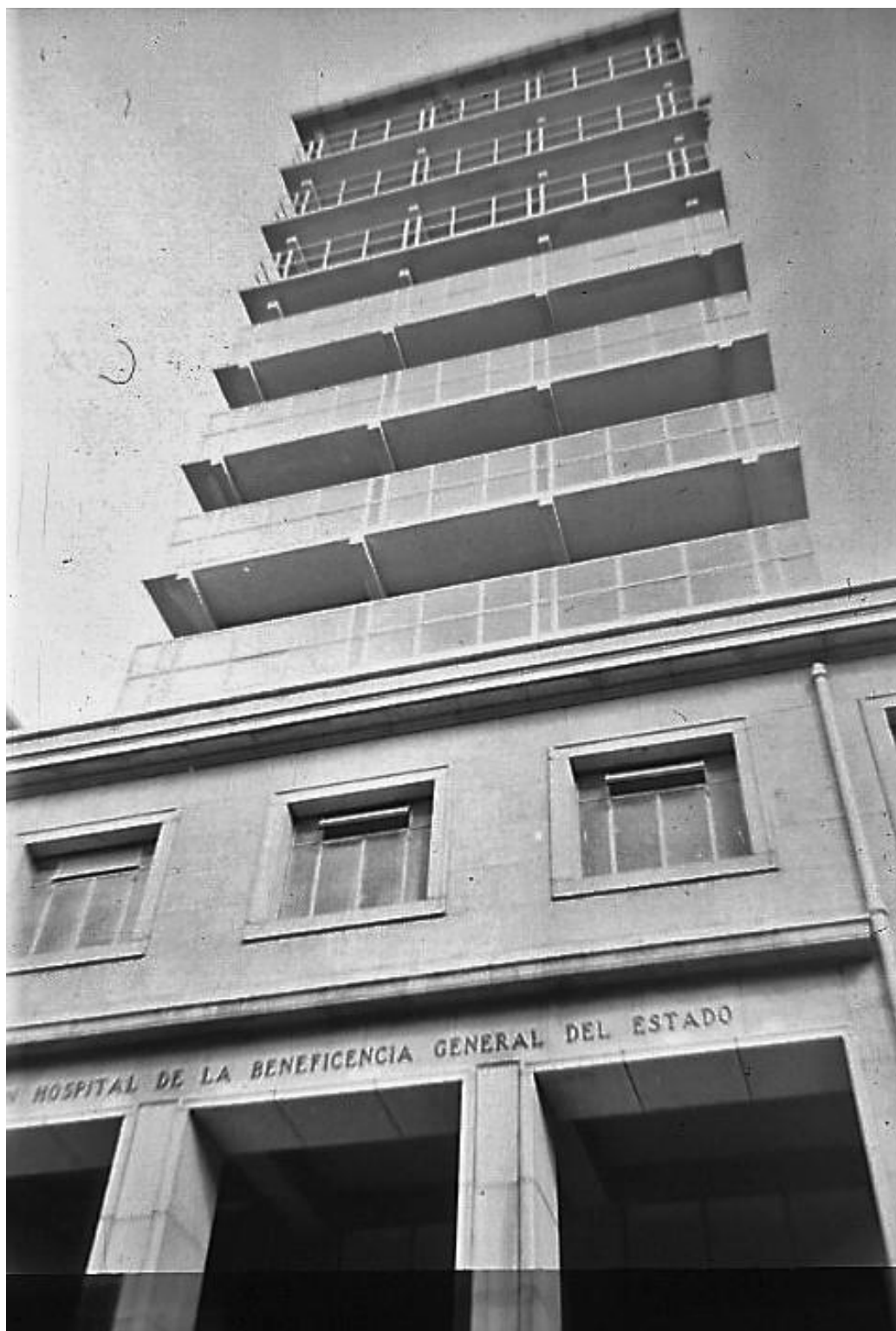
16° Una de las puertas del Hospital de la Beneficencia General del Estado En la fase final de su construcción. Año 1955. Se encuentra ubicada en la calle Maldonado.