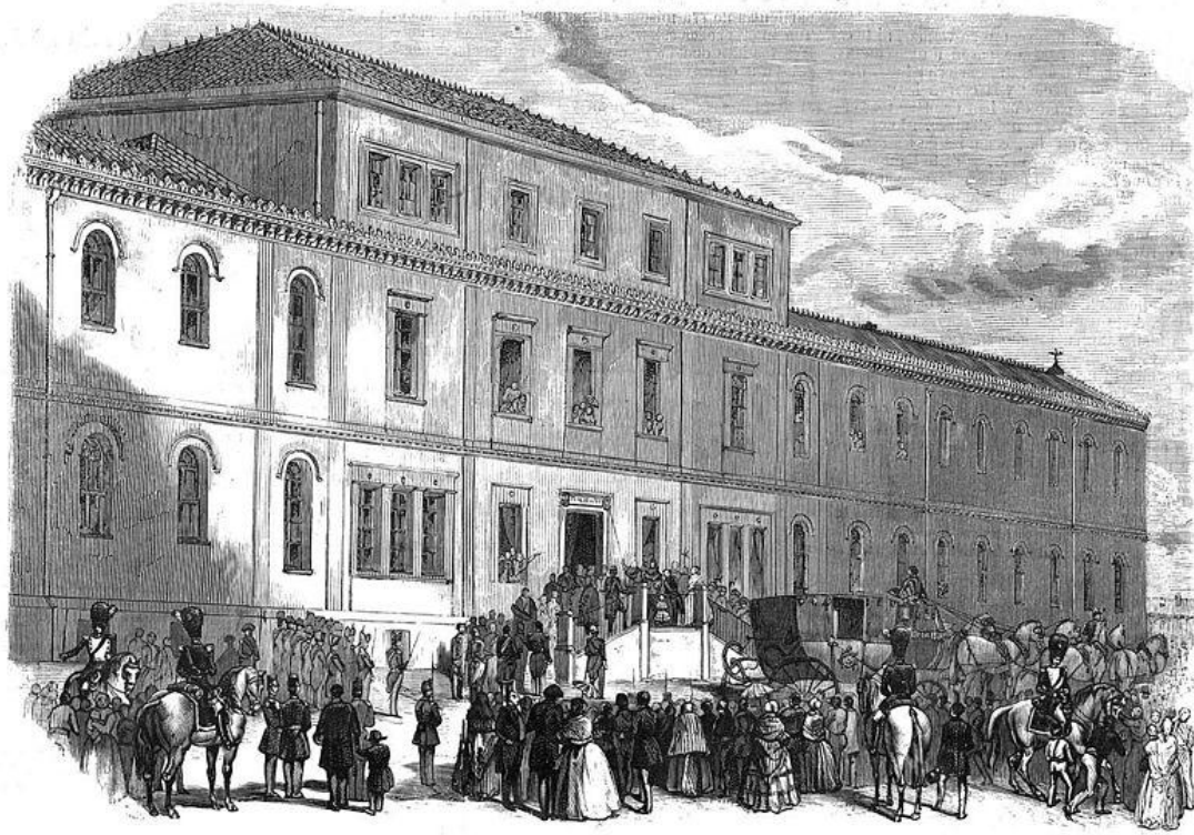
SOLEME INAUGURACION DEL HOSPITAL DE LA PRINCESA.