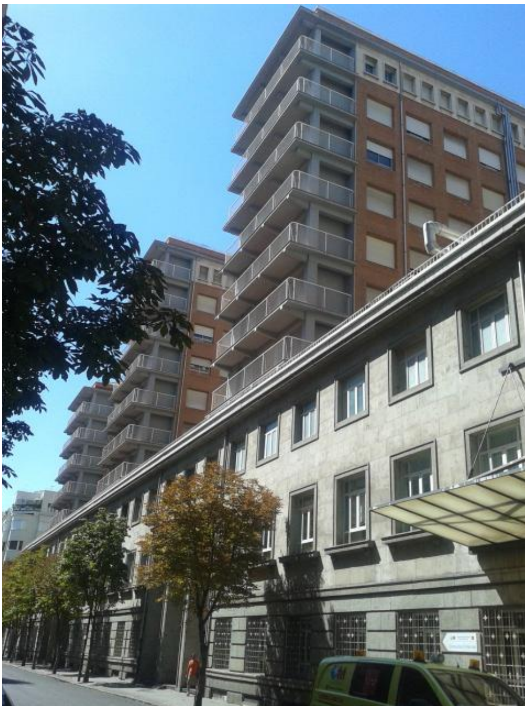
21º Vista de la fachada sur del Hospital desde la esquina Conde de Peñalver- Maldonado. Año 2006.