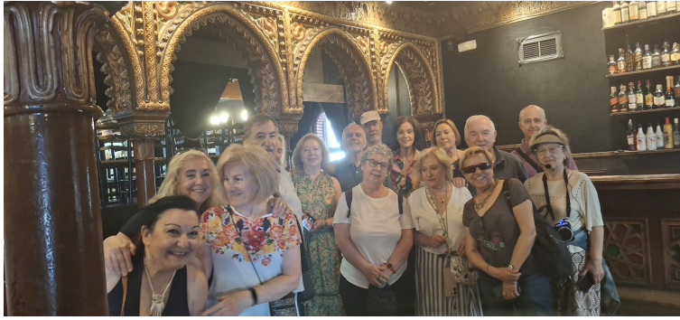
En el interior de Villa Rosa